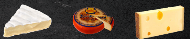
Roombrie Kernhem Emmentaler