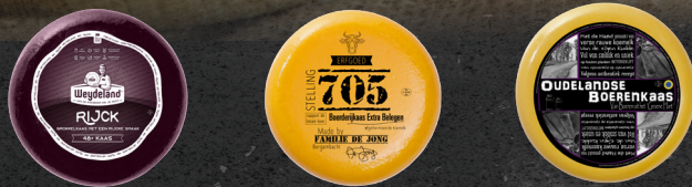
Weydeland 48+ Rijck Erfgoed Stelling Oudelandse Boeren