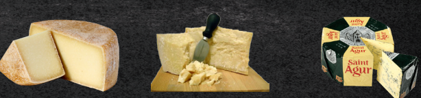
Pecorino Parmesan Reggiano Saint Agur