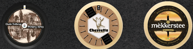
Oude Tolbrug Chevetta Mekkerstee