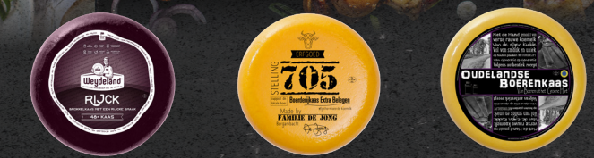
Weydeland 48+ Rijk Erfgoed Stelling Oudelandse Boeren