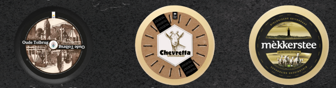
Oude Tolbrug Chevretta Mekkerstee