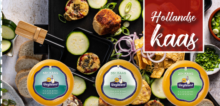
Weydeland 48+ Weydeland 35+ Weydeland 20+