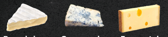
Roombrie Gorgonzola Emmentaler