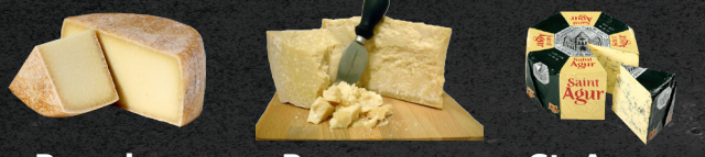
Pecorino Parmesan Reggiano St. Agur .....& nog meer!

Dagen dat ik niet bij u langskom Eerste Kerstdag woe 25 december Tweede Kerstdag do 26 december Oudjaarsdag di 31 december Nieuwjaarsdag woe 1 januari Vakantie ma 6 t/m vr 10 januari Vader & Zoon wkd ma 10 en di 11 maart Biddag woe 12 mrt vanaf 15:45 uur Witte donderdag do 17 april vanaf 20:00 uur Goede vrijdag vr 18 april Pasen ma 21 t/m vr 25 april voor alle actuele dagen: www.kaasathome.nl