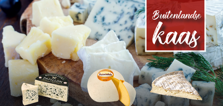
Roquefort Passendale Brie de Meaux